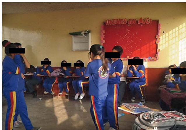
Imagen 1. Adolescentes desarrollando un sociodrama

Se utilizó SPSS 22.0, EPIDAT3.1 y Microsoft Office Excel 2010 para el análisis descriptivo, para el análisis de datos intervinientes se usó la distribución de frecuencias y porcentajes, y posteriormente se aplicó la Prueba de Wilcoxon, para muestras relacionadas, que es una prueba no paramétrica, ya que la muestra no es de distribución normal.