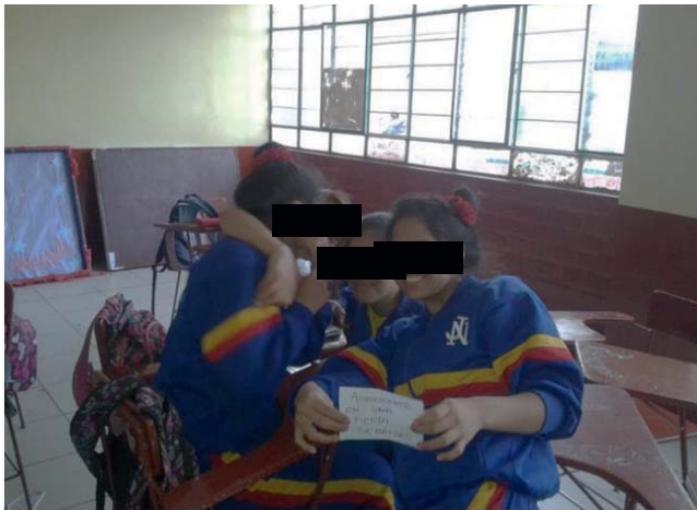
Imagen 2. Adolescentes desarrollando una discusión de casos