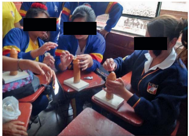
Imagen 3. Adolescentes en un taller sobre el uso correcto del preservativo masculino