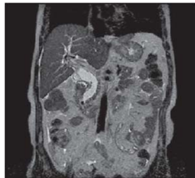
Figura 7. RMN de hígado y vías biliares, no se evidencia recidiva de enfermedad a los 6 meses de control post operatorio.