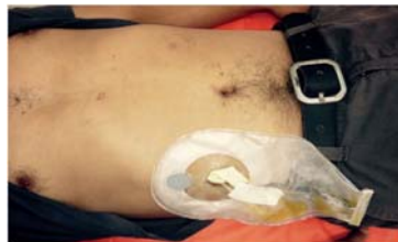
Figura 5. Paciente durante el seguimiento en consultorio externo de la cirugía y fistula biliar instaurada.

Paciente cursa en el postoperatorio inmediato con evolución favorable de los parámetros clínicos, afebril, con secreción sero-biliosa a través de drenaje mixto. Inicia tolerancia a las 24 horas de su postoperatorio y es dado de alta al 4 día, con gasto bajo por drenaje mixto de iguales características que su estancia hospitalaria. En consultorio externo se diagnosticó fistula biliar establecida, cuyo seguimiento se llevó a cabo hasta la resolución del mismo en 5 semanas, desde el postoperatorio, los controles ecográficos y séricos fueron normales (Figura 5 y 6).