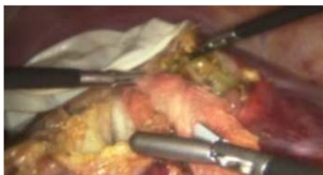
Figura 4. Legrado con las gasas embebidas con hipersodio en toda la pared quística, luego introducidas dentro de la bolsa colectora.

Se realizó liberación de adherencias, colocación de gasas embebidas con hipersodio, aspiración de contenido de quiste, instilación de solución hipertónica a cavidad de quiste, se deja solución por 5 minutos, y posteriormente se procedió a destechamiento de quiste, verificación de hallazgos, aspiración de contenido con remoción completa de vesículas, luego se realizó raspado con gasa con hipersodio en lecho quístico y finalmente colocación de drenes (laminar y tubular), en espacio de Morrison y en lecho de cavidad quística destechada, y colocación de epiplón mayor en dicha cavidad.