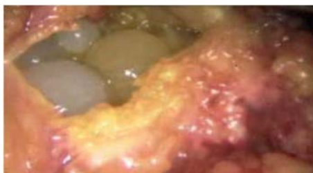
Figura 3. Apertura de pared quística y visualización de vesículas hijas.

Asociado a una prueba de Western Blot positivo para Hidatidosis, se decide realizar cirugía laparoscópica programada, previo tratamiento de un mes con albendazol a 10mg/Kg/día. Se evidencia en el intraoperatorio adherencias laxas y firmes de epiplón a vesícula biliar y estructura quística de 20x15 cm. de diámetro, que comprende los segmentos IVA, IVB y V, de paredes gruesas, conteniendo liquido turbio y biliar, además de vesículas hijas múltiples siendo la mayor de 6cm. aproximadamente; dentro de la cavidad del mismo, se evidencia comunicación con otro quiste más pequeño de 8x6cm., dependiente aparentemente de segmento I, que contiene abundantes vesículas, las cuales son removidas y absorbidas en su totalidad (Figura 3 y 4).