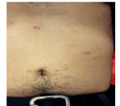
Figura 6. Paciente al alta de consultorio externo de cirugía.